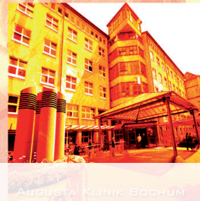
AUGUSTA KLINIK BOCHUM